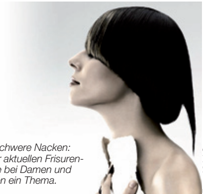
Der schwere Nacken: In der aktuellen Frisurenmode bei Damen und Herren ein Thema.