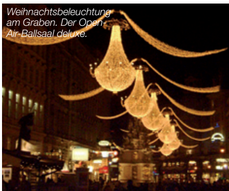
Weihnachtsbeleuchtung am Graben. Der Open-Air-Ballsaal deluxe.

+++ Es ist wieder so weit. Die gute alte Weihnachtszeit ist angebrochen; es duftet nach Glühwein und Zimt. Zahlreiche Adventsmärkte laden zum Bummeln und Verweilen ein. Gerade hier in Wien ist die schöne „stade Zeit“ („besinnliche Zeit“) wirklich noch greifbar. Es ist etwas ganz Besonderes, die Adventszeit in Wien zu verbringen - ich kann es meinen Kollegen aus Deutschland nur ans Herz legen. Beim anstrengenden Weihnachtsgeschäft im Salon ist es mehr als ein Ausgleich, die Adventsstimmung beim „after work“-Punsch zu genießen. Mein Favorit ist der Graben direkt beim Stephansdom, der Jahr für Jahr wieder in einen gigantischen Open-Air-Ballsaal verwandelt wird. Unter riesigen, beleuchteten Kronleuchtern kommt